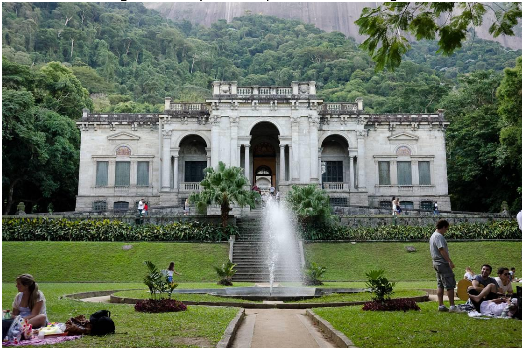
Figura 2 - Parque Lage - Rio de Janeiro / RJ.