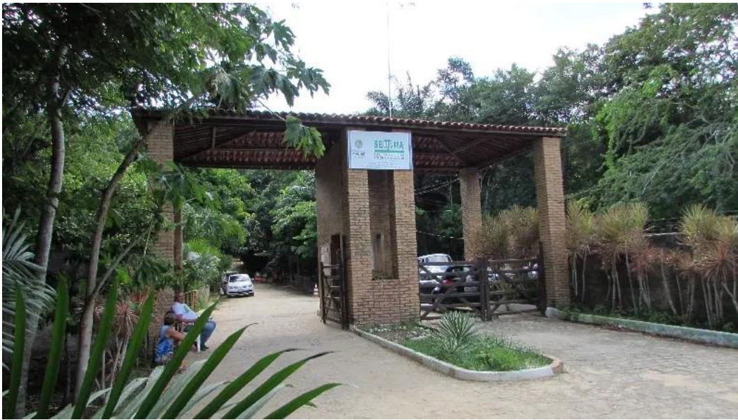
Figura 1 - Parque municipal de Maceió - Alagoas